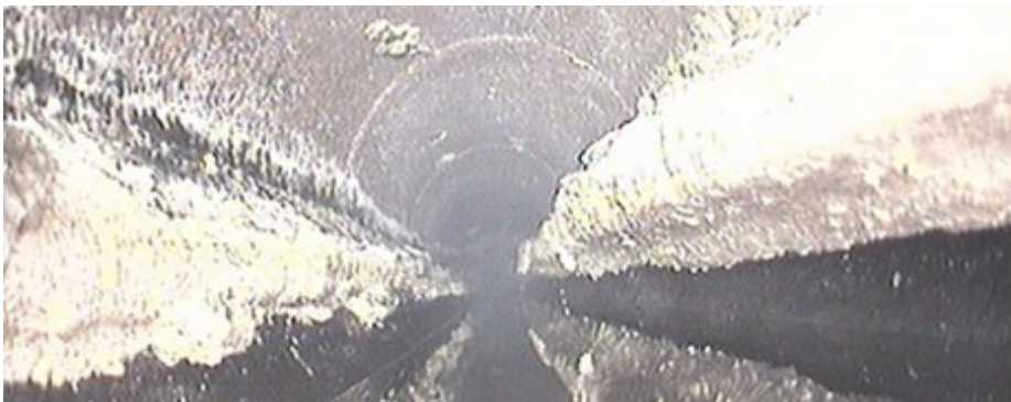
Fett som samlats på insidan av spillvattenledningar.

Kostnader för att hantera alla de avloppsstopp på grund av fett i avloppsledningsnätet drabbar i slutänden VA-kollektivet då dessa kostnader i sin tur räknas in i VA-taxan. Andra kostnader som kan uppstå är de skadekostnader som kan uppstå vid en översvämning som är orsakad av fettstopp i ledningen. Det är inte säkert att översvämningen sker i den fastighet som orsakat problemet utan det kan också ske längre nedströms i systemet.